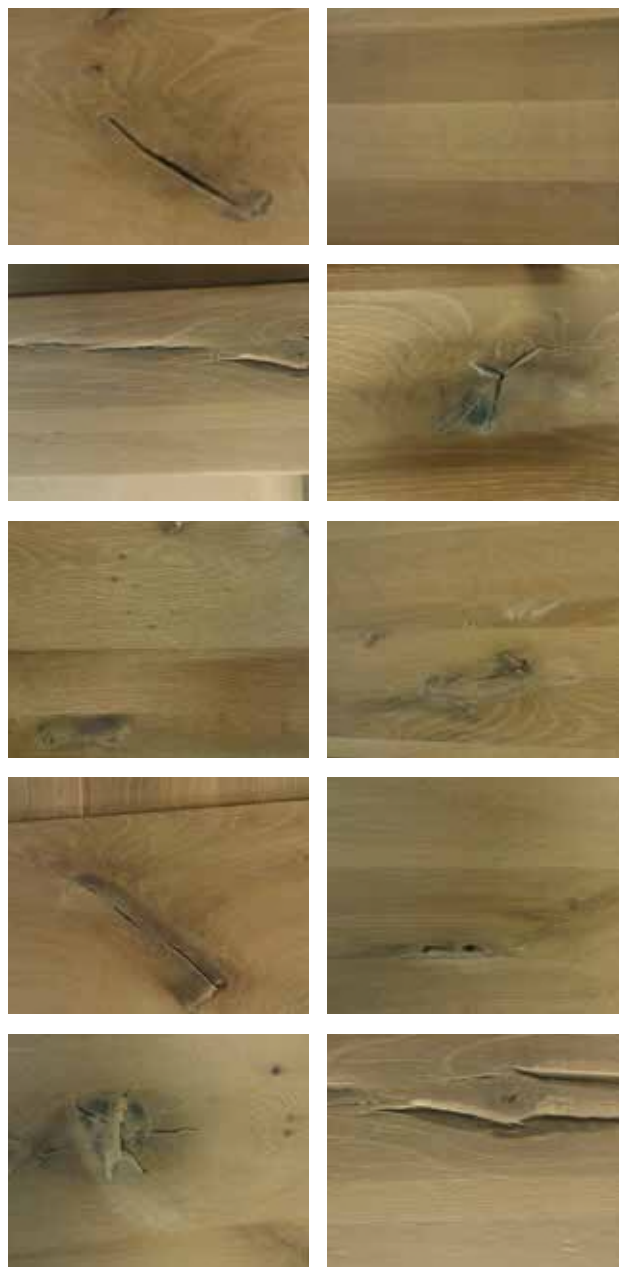
Dit zijn voorbeelden van noesten, kleurverschillen, scheuren, oude (worm-) gaatjes en andere oneffenheden die kunnen voorkomen.

Advies: Indien WaxOil het geadviseerde onderhoudsmiddel is, dan altijd dun aanbrengen in de lengterichting van het hout en nadien in de lengterichting van het hout zeer goed uitwrijven. Olie kan de houtnerf accentueren; probeer de olie daarom eerst uit op een onopvallende plaats, bijvoorbeeld aan de onderkant van een plank. Natural Wood Cleaner is een agressief reinigingsmiddel en kan de kleur en de beschermende (lak)laag aantasten. Probeer Natural Wood Cleaner altijd eerst op een onopvallende plek en bekijk of de kleur en de beschermende (lak)laag niet worden aangetast. Het is belangrijk dat dit product niet te intensief op een klein oppervlak wordt toegepast, maar egaal en verdund over het oppervlak wordt verwerkt. Zo worden kleurafwijkingen en/of optische vlekvorming voorkomen. Pronto Wonen kan niet aansprakelijk gesteld worden voor schade of tegenvallende resultaten die zijn ontstaan door het gebruik van Natural Wood Cleaner.