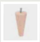
098 Taps rond