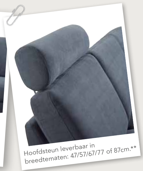
Hoofdsteun leverbaar in breedtematen: 47/57/67/77 of 87cm.**

*De elektrische relaxfunctie (met tiptoetsen aan de zijkant van de zitting evt. met accu) is alleen mogelijk in de 1- en 1,5-zitselementen. Om een 2-, 2,5- of 3 zitsbank met elektrische relaxfunctie te verkrijgen, dient deze te worden samengesteld met een 1 of 1,5-zits element. Wordt een element met relaxsysteem gecombineerd met een vast element dan kunnen hier onderling verschillen in afmetingen ontstaan doordat beide elementen een andere opbouw hebben. **Voor de Longchair smal kan enkel gekozen worden voor hoofdsteun NF67. Voor de Longchair breed kan enkel gekozen worden voor hoofdsteun NF87.