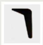
2H4K schuin zwart