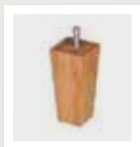
015 Taps rechthoek