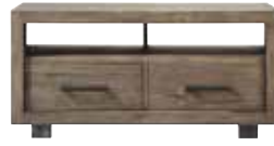
TV-/audiodressoir 2 laden, 2 vakken H59xB120xD45cm