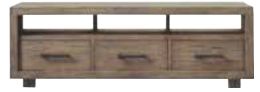
TV-/audiodressoir 3 laden, 3 vakken H59xB175xD45cm