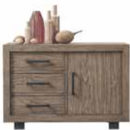
Kommode 1 deur, 3 laden H75xB110xD41cm