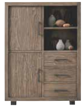
Bergkast 2 deuren, 3 laden, 2 vakken H162xB120xD45cm