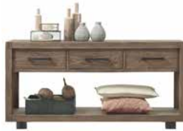
Wandtafel 3 laden, 1 vak H78xB160xD40cm