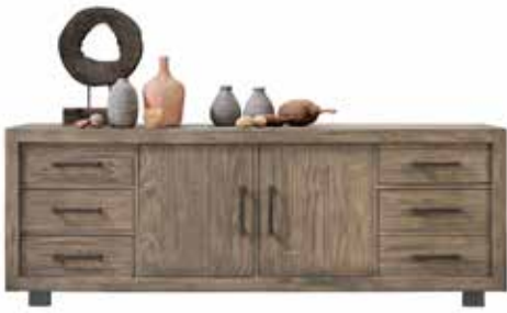
Dressoir 2 deuren, 6 laden H75xB210xD46cm