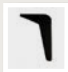
2H4K schuin zwart