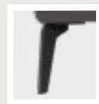
2H4B schuin metaal