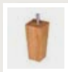
0I5 Taps rechthoek