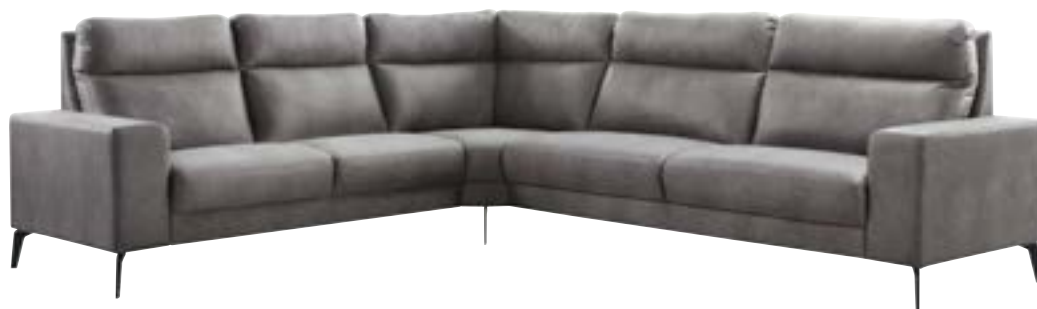
2,5-Zits (2x70) met arm, 2,5-zits (2x80) met arm

Noteer bij het samenstellen van de modellen van links naar rechts (voorstaand). De lijntekeningen kunnen afwijken van de werkelijke uitvoering. Hieraan kunnen geen reclamaties en/of rechten worden ontleend.