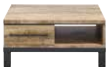
Salontafel 1 lade, 1 vak L85xB85xH40cm 10329992 Maat open vak: ±H16xB40xD84