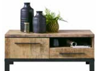
TV-meubel 1 deur, 1 lade, 1 vak H48xB115xD45cm 10308204 Maat open vak: ±H13xB55xD45cm Open vak voorzien van ronde opening voor kabeldoorvoer