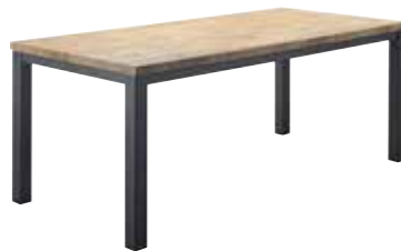
Eettafel L190xB90xH78cm 10315799 Ruimte tussen poten: ±178cm