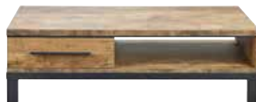
Salontafel 1 lade, 1 vak L135xB67xH40cm 10317014 Maat open vak: ±H16xB66xD75