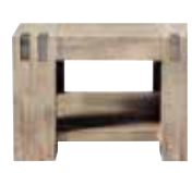
Bijzettafel met onderblad L65xB65xH42cm 10137527 Maat open vak: ±H24xB35xD64cm