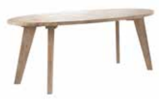
Eettafel ovaal L220xB110xH78cm 10150494 Ruimte tussen poten: ±150cm