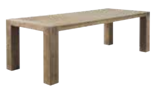
Eettafel L160xB90xH78cm Ruimte tussen poten: ±130cm 10137509 L190xB95xH78cm ±160cm 10137510 L220xB100xH78cm ±190cm 10137511 L250xB105xH78cm ±220cm 10137512