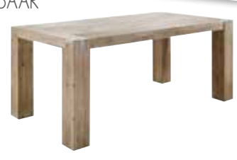
Eettafel L190/240xB95xH78cm 10214189 Ruimte tussen poten: ±160/200cm