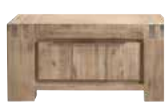
Salontafel 2 laden L88xB88xH42cm 10150145