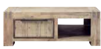
Salontafel 2 laden, 1 vak L140xB80xH42cm 10137526 Maat open vak: ±H25xB46xD79cm