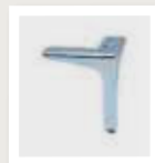
1A6A recht chroom 1A6K recht zwart