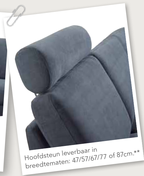
Hoofdsteun leverbaar in breedtematen: 47/57/67/77 of 87cm.**

*De elektrische relaxfunctie (met tiptoetsen aan de zijkant van de zitting optioneel met accu) is alleen mogelijk in de 1- en 1,5-zitselementen. Bij de relaxfunctie dient altijd een bijpassende hoofdsteun te worden besteld. Om een 2-, 2,5- of 3 zitsbank met elektrische relaxfunctie te verkrijgen, dient deze te worden samengesteld uit twee 1- of 1,5-zits elementen. Wordt een element met relaxsysteem gecombineerd met een vast element dan kunnen hier onderling verschillen in afmetingen ontstaan doordat beide elementen een andere opbouw hebben. Het is niet mogelijk om een element met relaxfunctie te combineren met een longchair, daar de voetsteun dan vast kan lopen tegen de zijkant van de longchair. Let erop dat de breedte van de hoofdsteun nooit breder is dan het rugkussen.