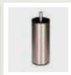
046B rond Ø6cm geborsteld