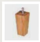
015 Taps rechthoek