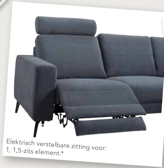
Elektrisch verstelbare zitting voor: 1, 1,5-zits element.*