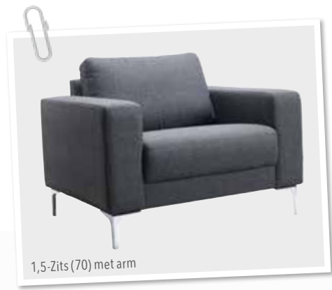
1,5-Zits (70) met arm

*De elektrische relaxfunctie (met tiptoetsen aan de zijkant van de zitting optioneel met accu) is alleen mogelijk in de 1- en 1,5-zitselementen. Bij de relaxfunctie dient altijd een bijpassende hoofdsteun te worden besteld. Om een 2-, 2,5- of 3 zitsbank met elektrische relaxfunctie te verkrijgen, dient deze te worden samengesteld uit twee 1- of 1,5-zits elementen. Wordt een element met relaxsysteem gecombineerd met een vast element dan kunnen hier onderling verschillen in afmetingen ontstaan doordat beide elementen een andere opbouw hebben. Het is niet mogelijk om een element met relaxfunctie te combineren met een longchair, daar de voetsteun dan vast kan lopen tegen de zijkant van de longchair. Let erop dat de breedte van de hoofdsteun nooit breder is dan het rugkussen.