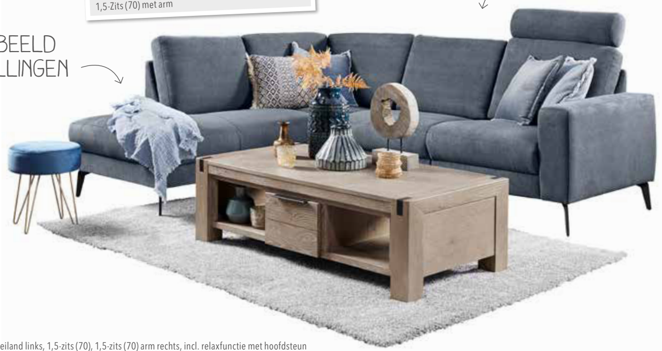
Hoek met eiland links, 1,5-zits (70), 1,5-zits (70) arm rechts, incl. relaxfunctie met hoofdsteun