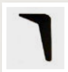
2H4K schuin zwart