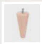
098 Taps rond