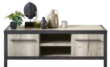
TV-meubel 2 deuren, 2 vakken H47xB130xD50cm 10317017 Maat open vak: ± H13xB40xD47cm Open vak voorzien van ronde opening voor kabeldoorvoer