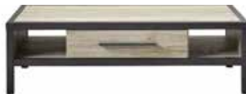
Salontafel 1 lade, 2 vakken L135xB67xH40cm 10317022 Maat open vak: ±H16xB29xD66cm