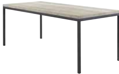
Eettafel L190xB90xH78cm 10315801 Ruimte tussen poten: ±182cm