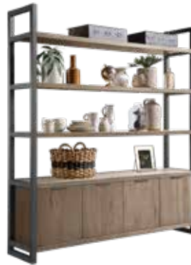
Wandkast 4 deuren, 3 vakken