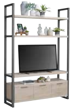
TV-kast 3 laden, 3 vakken