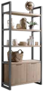
Wandkast 2 deuren, 3 vakken

Divino is een stoer wandkastconcept van massief geborsteld Eikenhout met een stalen frame & handgrepen. Het Eikenhout is afgewerkt met een olie in de kleuren Rhino, Moose en Olie Grijs. Deze 3 kleurafwerkingen zijn snel leverbaar. Voor een kleine meerprijs is er keuze uit meer dan 10 kleuren. De laden & deuren zijn voorzien van een softclose systeem.