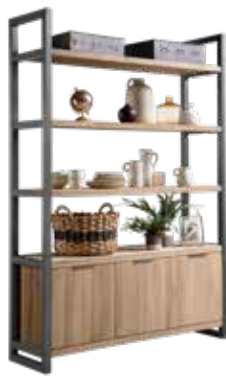
Wandkast 3 deuren, 3 vakken