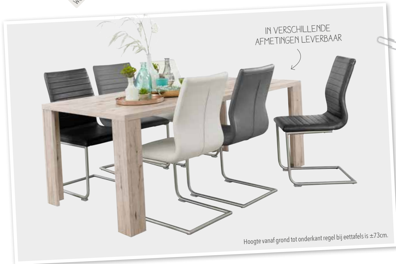
Hoogte vanaf grond tot onderkant regel bij eettafels is ±73cm.

Moritz is een compleet woonprogramma met een moderne uitstraling in de kleur Zand Eiken. Moritz is gemaakt van hoogwaardige meubelpanelen met een krasvaste 3D-decorlaag. De 3D-decorlaag ziet er uit als echt hout en heeft een licht reliëf.