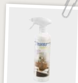
Multi Cleaner 10214095

Alle verzorgings- en reparatiemiddelen die wij in dit boekje hebben genoemd, zijn bij ons verkrijgbaar.