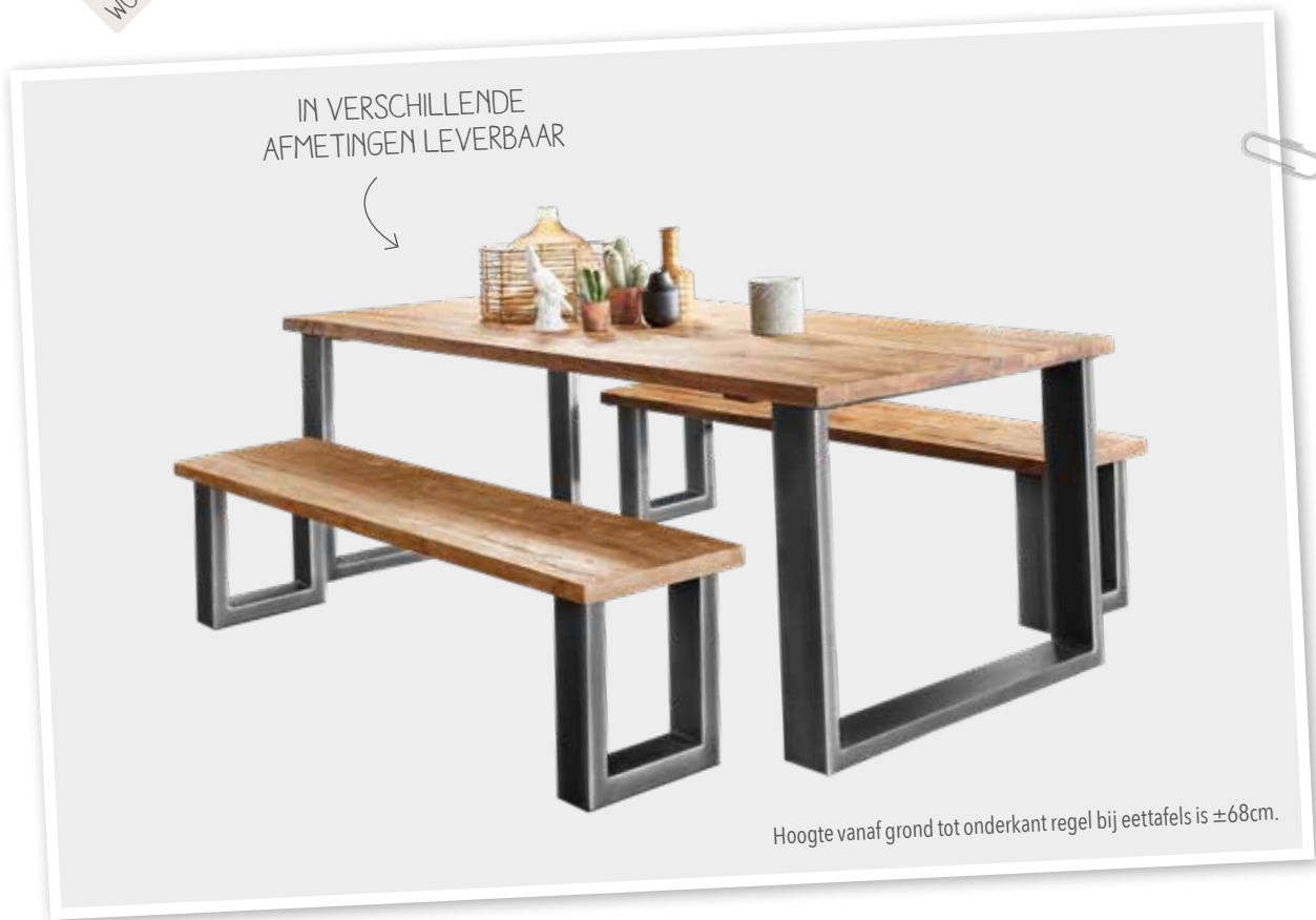
Hoogte vanaf grond tot onderkant regel bij eettafels is ±68cm.

Romaro is een woonprogramma met een stoere uitstraling. De houten elementen zijn samengesteld uit een mix van geborsteld massief rough teakhout. De grof gelaste metalen frames tezamen met het ruige teak geven Romaro zijn karakter. Romaro wordt ambachtelijk gemaakt. Hierdoor heeft elk meubel zijn eigen, unieke karakter.