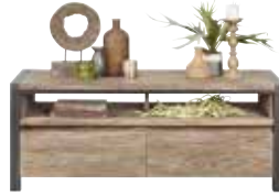
TV-/audiodressoir 2 laden, 2 vakken H52xB130xD45cm