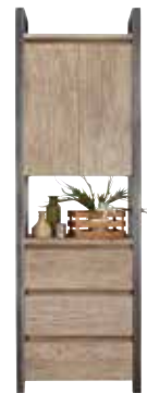
Boekenkast 2 deuren, 3 laden, 1 vak H215xB70xD40cm