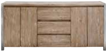
Dressoir 4 deuren, 3 laden H85xB190xD45cm