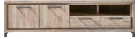
TV-/audiodressoir 2 deuren, 2 laden, 2 vakken H54xB193xD45cm