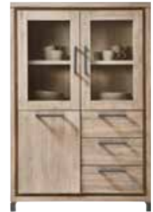
Kast 2 glasdeuren, 1 deur, 3 laden H153xB103xD40cm