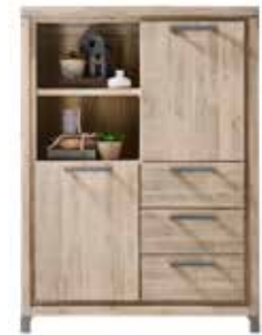
Kast 2 deuren, 3 laden, 2 vakken H140xB103xD40cm