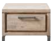
Bijzettafel 1 lade L60xB60xH40cm