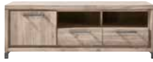
TV-/audiodressoir 1 deur, 2 laden, 2 vakken H54xB148xD45cm