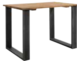
Bartafel L130xB80xH90cm Ruimte tussen poten: ±106cm 10168000