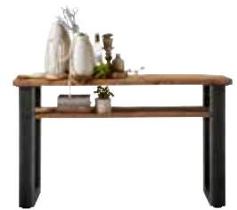
Wandtafel H80xB140xD38cm 10167995

Hoogte vanaf grond tot onderkant regel is ±84cm.