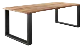
Eettafel L190xB95xH78cm Ruimte tussen poten: ±158cm 10167997