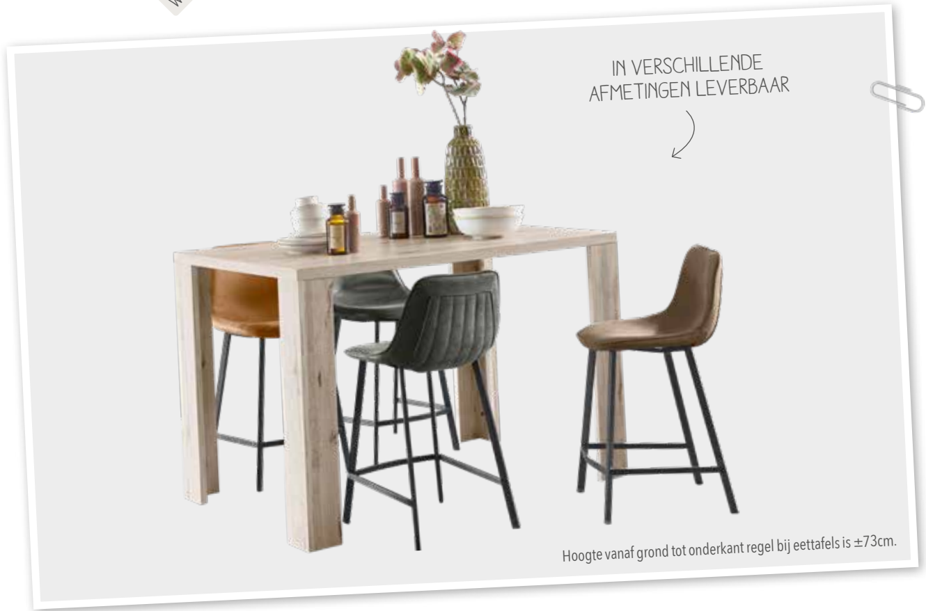
Hoogte vanaf grond tot onderkant regel bij eettafels is \pm 73 cm.

Moritz is een compleet woonprogramma met een moderne uitstraling in de kleur Zand Eiken. Moritz is gemaakt van hoogwaardige meubelpanelen met een krasvaste 3D-Decorlaag. De 3D-Decorlaag ziet er uit als echt hout en heeft een licht reliëf.