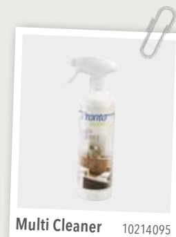
Multi Cleaner 10214095

Alle verzorgings- en reparatiemiddelen die wij in dit boekje hebben genoemd, zijn bij ons verkrijgbaar.