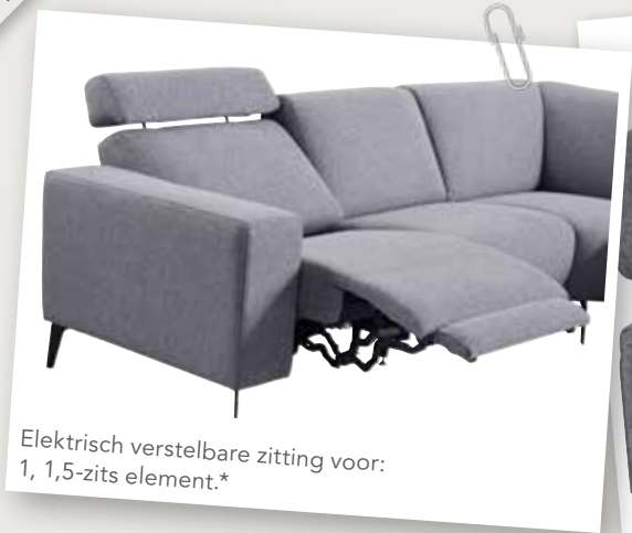
Elektrisch verstelbare zitting voor: 1, 1,5-zits element.*