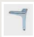
1A6A recht chroom 1A6K recht zwart