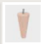
098 Taps rond