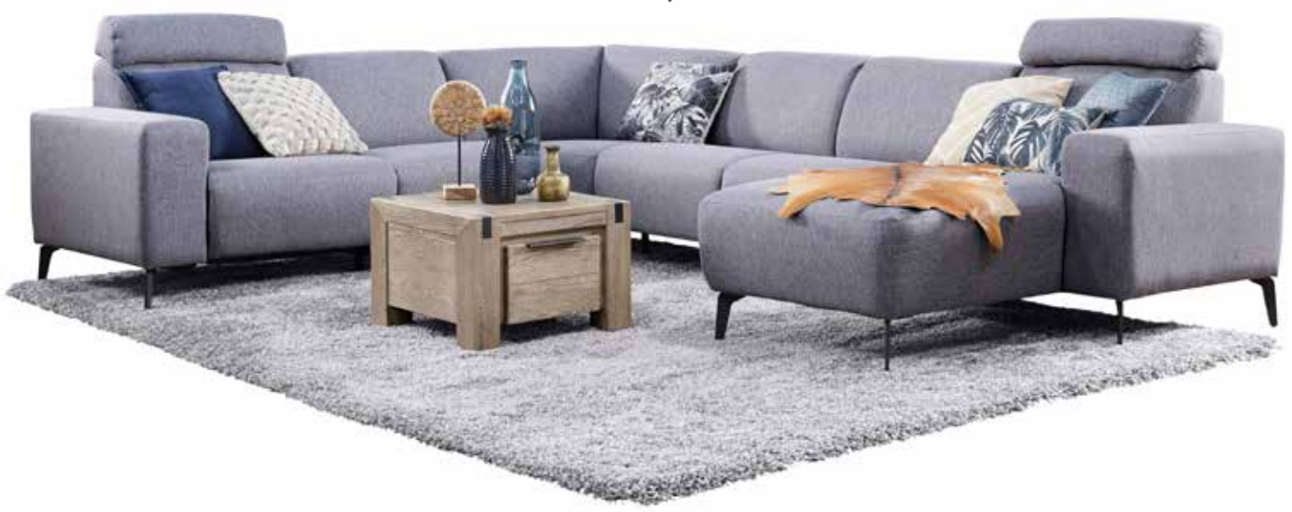
1,5-Zits (70) arm links incl. relaxfunctie met hoofdsteun, 1,5-zits (70), grote hoek, 2,5-zits (2x70), longchair smal met arm rechts met hoofdsteun

COMBINEER MET DIVERSE ELEMENTEN & MAAK ZO JE EIGEN IDEALE ZITHOEK!