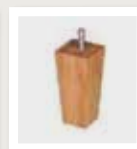
015 Taps rechthoek