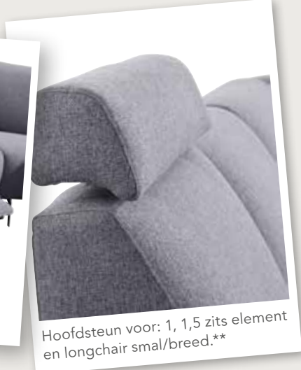
Hoofdsteun voor: 1, 1,5 zits element en longchair smal/breed.**

*Een element met elektrisch verstelbare relaxfunctie wordt standaard geleverd incl. hoofdsteun. De elektrische relaxfunctie (met tiptoetsen aan de zijkant van de zitting evt. met accu) is alleen mogelijk in de 1- en 1,5-zitselementen. Om een 2-, 2,5- of 3 zitsbank met elektrische relaxfunctie te verkrijgen, dient deze te worden samengesteld met een 1 of 1,5-zits element. Wordt een element met relaxsysteem gecombineerd met een vast element dan kunnen hier onderling verschillen in afmetingen ontstaan doordat beide elementen een andere opbouw hebben. **De hoofdsteun is enkel te bestellen voor een 1, 1,5-zits element en een longchair