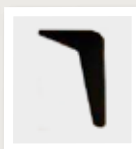
2H4K schuin zwart