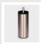
046B rond Ø6cm geborsteld