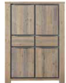
Kast 4 deuren, 2 laden H166xB120xD45cm 10256097