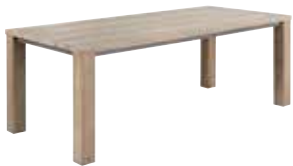
Eettafel L160xB90xH78cm ±137cm 10256100 L190xB95xH78cm ±167cm 10256101 L220xB100xH78cm ±197cm 10256102