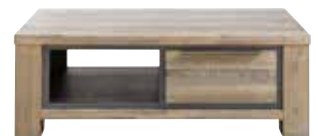
Salontafel 2 laden, 1 vak L120xB73xH41cm 10256094

Hoogte vanaf grond tot onderkant regel is ±72cm