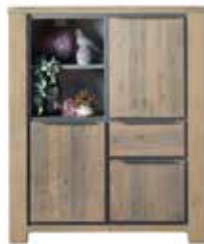
Combikast 3 deuren, 1 lade, 2 vakken H142xB120xD45cm 10256096