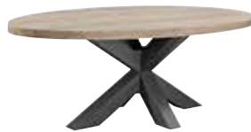
Eettafel L230xB115xH78cm 10256104

Hoogte vanaf grond tot onderkant regel is ±72cm